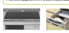
IHクッキングヒーター 食器洗い乾燥機